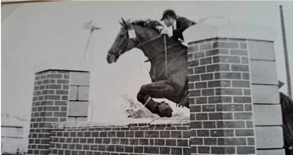
Deutsche Jugendmeisterschaft Springen in Pfungstadt mit Husar.