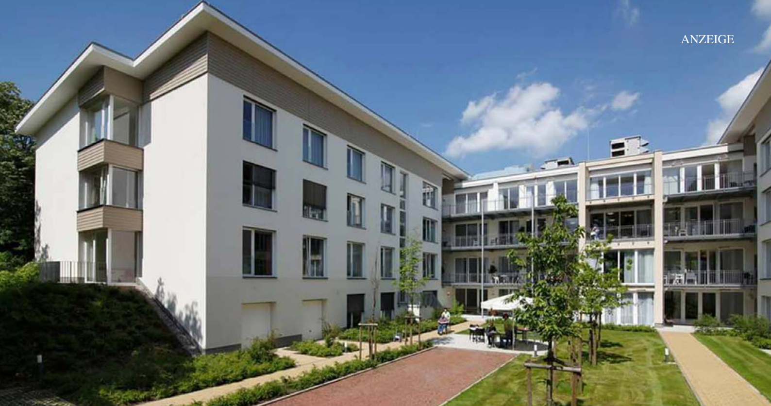
Das „Haus am Zoo“ präsentiert sich ab sofort im Zeichen der türkisfarbenen Blume.