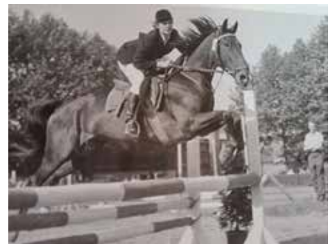
Springen in St.Arnual mit Fledermaus.

Mittlerweile standen zwei eigene Pferde im Stall: Zuerst Fledermaus und dann kam Ramona dazu, die man von German Schneider gekauft hatte. Fledermaus erholte sich leider von einer Kolik nicht mehr, dafür kam Direx, ein sechsjähriger Fuchs, den ihr Vater von einer Auktion in Verden hatte. Ramona blieb nicht lange, bekam zwei Fohlen als Totgeburt und war nicht mehr wie vorher, so wechselte sie den Besitzer. Mit ihr konnte sie bis dahin jedoch einige Erfolge verzeichnen, so unter anderem in Einöd den 3. Platz in einem M-Springen. Für Ramona kam „Welf“, den man einem Bauer von der Wiese runter kaufte.