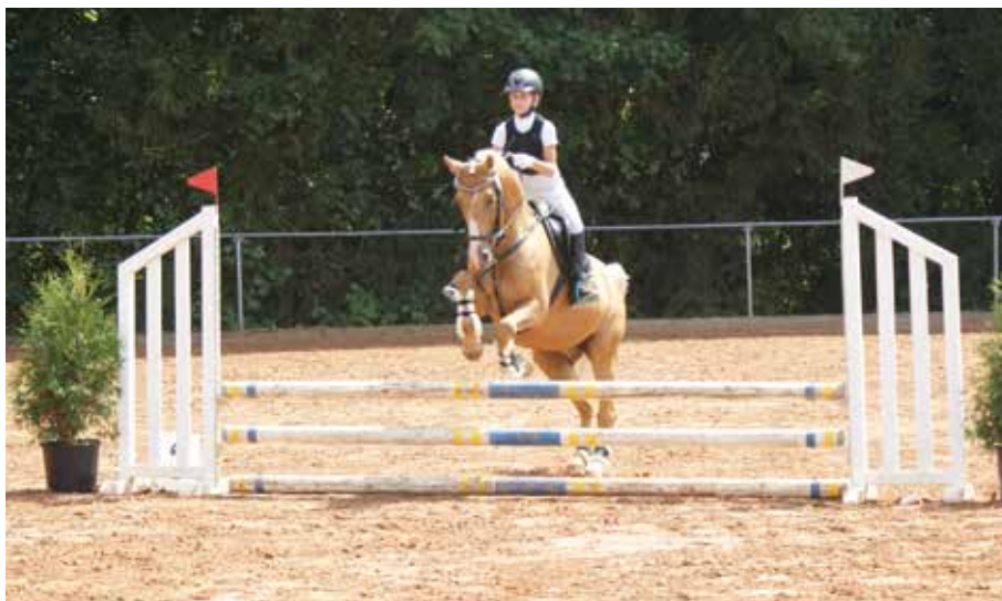
Irgendwann in Marpingen.